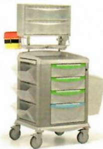
(Zdjęcie poglądowe oferowanego wózka)

Czy Zamawiający dopuści wózek wyposażony w pojemnik z pokrywą montowany do wózka o poj. 14l – 2 szt.?